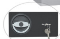
ML 45T29/S1-K (K-zamek kluczowy)