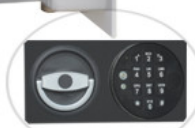
ML 45T29/S1-E (E-zamek elektroniczny)

Szuflada wrzutowa otwarta w tyle szuflady mieści się szczelina wrzutowa wrzut następuje po zamknięciu szuflady