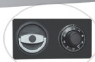
ML 45T29/S1-S (S-zamek szyfrowy mechaniczny)